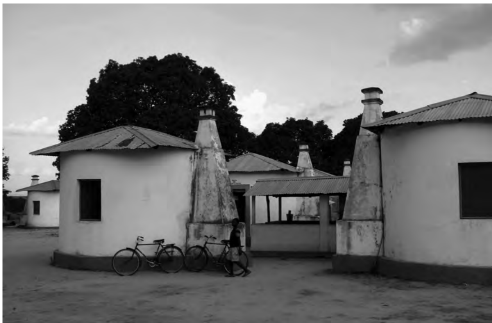
Figura 2 – Hospital do Gilé, Nampula, Moçambique. Fotografia de Patrícia Lopes (c. 2011).

contadas – com alguma esperança de encontrar dados para a datação de uma das realizações daquilo que poderia ter sido o programa dos hospitais-palhota que conhecia apenas do modelo encontrado no IHMT. Mas não: o que se dizia sobre aquelas casas era que tinham sido um conjunto habitacional originalmente feito para alojar os trabalhadores de uma dada empresa, depois adaptadas para hospital.