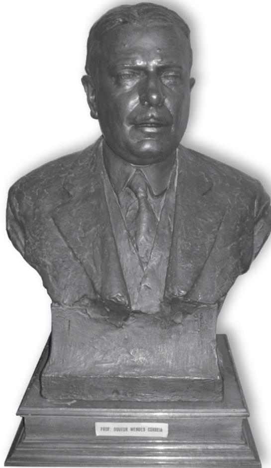
Figura n.º 3 – Busto em bronze de Mendes Correia, Museu de História Natural da Faculdade de Ciências da Universidade do Porto.

poder constatar a sua teoria luso-tropical. A tese de Gilberto Freyre viria a ser incorporada pelo sistema político português e utilizada em ocasiões oficiais, nacionais e internacionais.