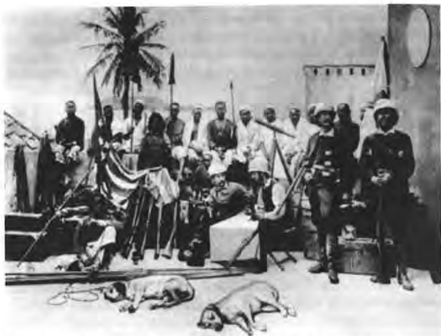
Fig 2. Stanley e Serpa Pinto em África. Fotografia de época, 1877, colecção Everett, disponível em poster comercial e amplamente divulgado na internet

Das explorações de Serpa Pinto, Brito Capelo e Roberto Ivens conhecemos a história, sobretudo a que nos narraram e que a imprensa ecoou em larga escala. Sabemos que partiram de Luanda; que se cruzaram com Stanley, encontro imortalizado em imagem e época.