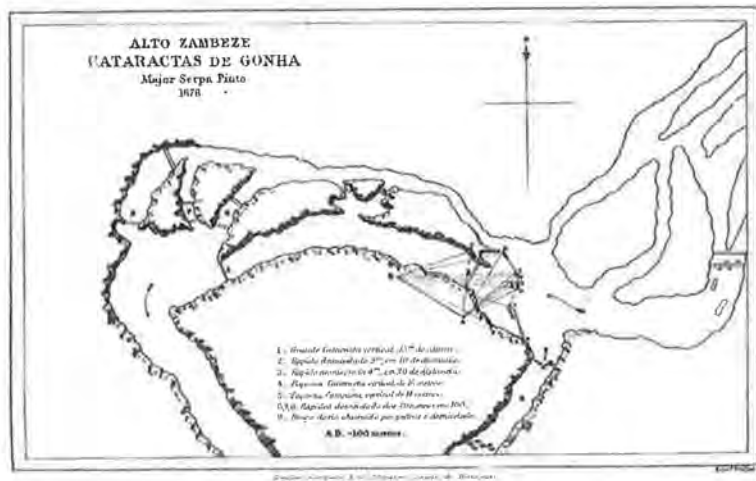
Figuras 6a, 6b e 6c – Documentos da viagem de Serpa Pinto, publicados em Facsimile em Como Atravessei a África , disponíveis em www.gutenberg.org/files/20783/20783-h/images

Escassos são os dias que Serpa Pinto passa em Portugal. Ainda na sessão da SGL, comunica aos sócios que “por indicação do governo, partiria brevemente para o estrangeiro” (SGL, 25/6/1879). Segue para Inglaterra e França, onde continua as apresentações e relatos, visando mostrar, em palcos internacionais, e precisamente junto da concorrência, que estavam trilhados certos caminhos, que estavam abertas novas vias de conhecimento, e que ali estava a marca portuguesa. Alguns portugueses ofenderam-se com o despropósito de tão pouco tempo em Portugal e tanta passeata internacional, não realizando que o espectáculo tinha uma audiência externa que politicamente era crucial. Mas Serpa Pinto parecia perceber a importância simbólica que revestia a sua missão, mesmo que a apresentasse com a devida modéstia.