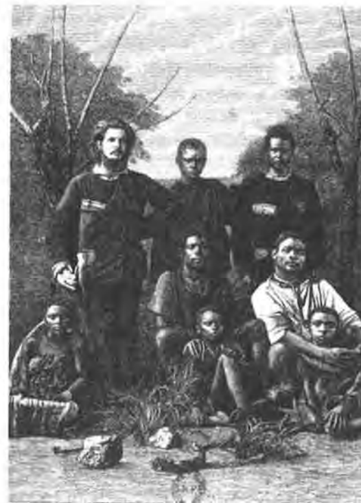
Fig 4. Serpa Pinto e os carregadores no final da viagem (Ilustração de Como Atravessei a África , disponível em www.gutenberg.org/files/20783/20783-h/images )