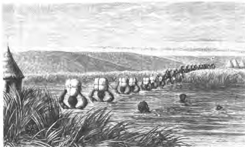
Figura 1. Carregadores de Serpa Pinto (Ilustração de Como Atravessei a África , disponível em www.gutenberg.org/files/20783-20783-h/images )

dos mantimentos, roupas, armas, pólvora, botica, ferramentas, caixas de música e um largo número de fazendas, lenços coloridos e missangas. Para transportar tudo isso foram necessários grandes contingentes de carregadores africanos, nem sempre fáceis de contratar. Alguns dos que chegaram ao fim da expedição acompanharam os exploradores a Portugal – eram mais uma evidência, um pedaço de realidade a dar autenticidade à narrativa que vieram a contar.