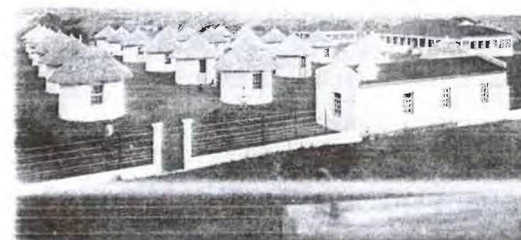
Figura 5: Vista geral de uma enfermaria regional, publicada num opúsculo de divulgação da assistência médica em Moçambique junto da exposição colonial internacional de Paris em 1931

Ferreira dos Santos, Colonie de Moçambique