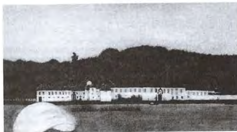
Figura 2b: Imagem da Casa da Pólvora enquanto Hospital Real Militar, fins do século XVIII