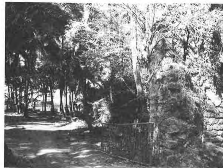
Figura 1: Ruínas do Hospital Real, Velha Goa