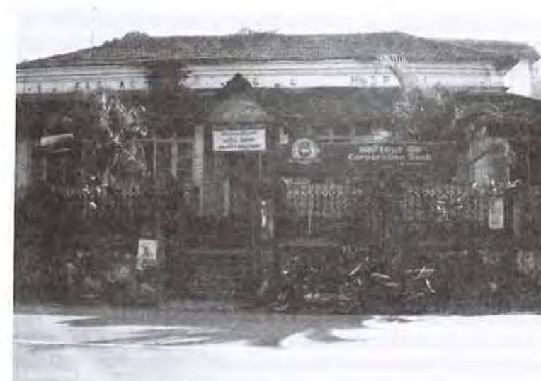
Figura 3: Dependências do antigo Palácio da Casa da Pólvora, hoje Instituto de Gestão de Goa, em Panelim. No friso pode ainda ler-se "Farmacia do Hospital"