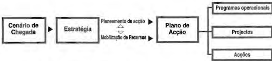
Figura 2 – Esquema de modelo de estratégia possível num processo de revitalização

cionais de menor escala (programas operacionais, projectos e acções) que darão resposta a objectivos específicos. Deve ainda activar diferentes modelos de participação, intervenção, monitorização e avaliação, de modo concreto, metodologicamente orientado e com objectivos e metas mensuráveis.