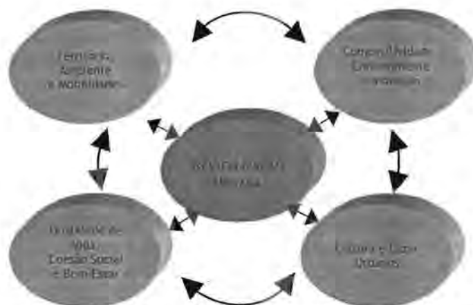
Figura 1 - Dimensões de Intervenção da Revitalização Urbana

perspectiva sistémica do sistema territorial de onde recolhe a sua lógica própria e a sua identidade específica.