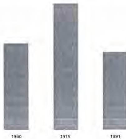
Evolução da Nupcialidade

Em Portugal, a tendência registada nas 3 últimas décadas é semelhante à descrita, embora a evolução seja mais acidentada e o pico de inversão da tendência mais tardio. Assim, a taxa de nupcialidade sobe regularmente desde 1960 (7,8 por