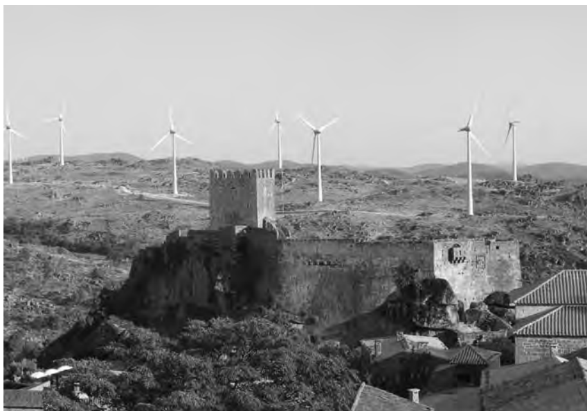
FIGURA 3 – Castelo de Sortelha e Parque Eólico do Troviscal

[...] paisagisticamente é uma ofensa. [...] Desde que nasceram cá as eólicas, Sortelha deixou de ter o mesmo significado para mim, por causa da proximidade, porque aqueles mamarrachos estão deslocados. Isto é uma aldeia com características medievais, onde há como que um regresso ao passado e de repente, para qualquer lado para onde eu olho, vejo ali os mamarrachos que entram pelas muralhas a dentro. (cofundadora do movimento, artesã)