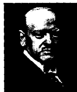
Gustav Stresemann (1878-1929)

Figura de proa do Partido Conservador inglês. Ministro dos Negócios Estrangeiros da Grã-Bretanha (1924-1929). Um dos impulsionadores do Pacto de Locarno (1925). Vencedor do Prémio Nobel da Paz em simultâneo com o Vice-Presidente dos EUA, Charles Gates Dawes (1925). Meio-irmão do primeiro-ministro Neville Chamberlain (1937-1940).