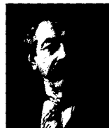
Aristide Briand (1862-1932)

Líder do Partido Liberal alemão. Fundador do Partido do Povo (1918). Antigo Chanceler (1923). Ministro dos Negócios Estrangeiros (1923-1929). Um dos negociadores do Pacto de Locarno (1925). Considerado o principal mestre da política externa alemã desde Bismarck. Prémio Nobel da Paz (1926). Grande adversário do Partido Nazi.