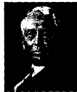
Frank Billings Kellogg (1856-1937)

Co-fundador com Jean Jaurés do Partido Socialista francês. Ministro dos Negócios Estrangeiros (1921-1922 e 1925-1932). Várias vezes primeiro-ministro (1921-1929). Artífice da reconciliação franco-alemã no período entre guerras. Impulsionador do Pacto Briand-Kellogg (1928). Pioneiro da construção da união europeia. Prémio Nobel da Paz (1926).