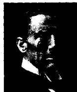
Sir Austen Chamberlain (1863-1937)

Figura de proa do Partido Conservador inglês. Ministro dos Negócios Estrangeiros da Grã-Bretanha (1924-1929). Um dos impulsionadores do Pacto de Locarno (1925). Vencedor do Prémio Nobel da Paz em simultâneo com o Vice-Presidente dos EUA, Charles Gates Dawes (1925). Meio-irmão do primeiro-ministro Neville Chamberlain (1937-1940).