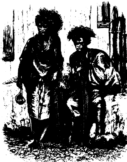
TIMOR MEN. (From a photograph.)

Figura II: “Homens de Timor”. No livro de Wallace, esta ilustração de timorenses acentuava características físicas tipicamente “negróides”: a pele negra, o cabelo crespo (Wallace, 1869: 150).