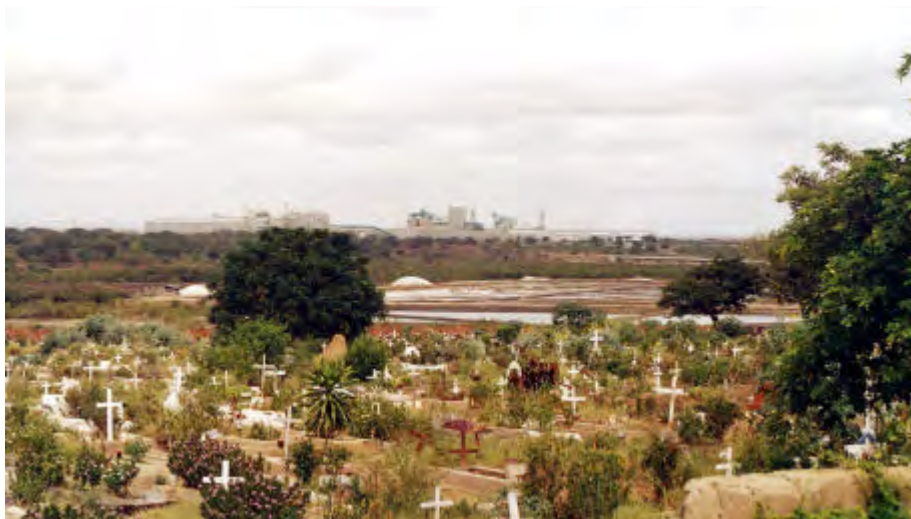
Figura 2. Mozal, vista do cemitério da Matola

Acontece que a Mozal é, certamente, um desses sítios especiais. É-o por muitas razões: pela sua grande dimensão e a modernidade da sua tecnologia; pela rigorosa organização de trabalho que tanto contrasta com os hábitos locais; por a língua laboral ser o inglês; pela elevada temperatura dos fornos, que muitas pessoas associam à temperatura ambiente a que se trabalha; pelos receios acerca do seu