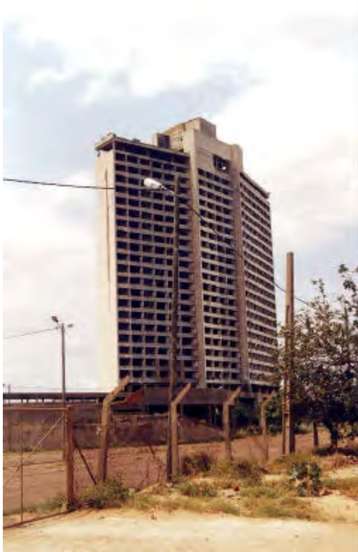
Figura 1. Ruínas do Hotel Quatro Estações

Dizem os engenheiros e as autoridades oficiais que o Hotel Quatro Estações – um nome particularmente curioso, numa zona do globo que as não tem – estava em plena construção em 1975, por altura da independência de Moçambique. Em resultado desta e do clima que se instaurou entre os portugueses residentes na até